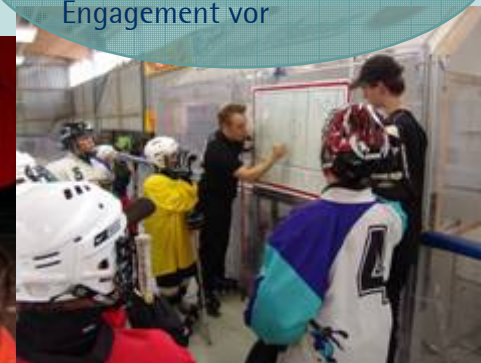
EHC Moskitos Essen e.V.

„Dafür engagiere ich mich!“ – Mitarbeiter/innen stellen im Intra- und Internet ihr privates Engagement vor