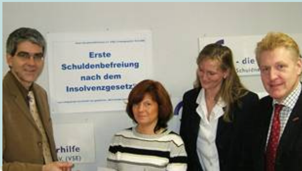
Verein Schuldnerhilfe e.V.